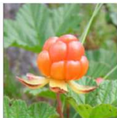
Hjortron (Mûre Boréale)