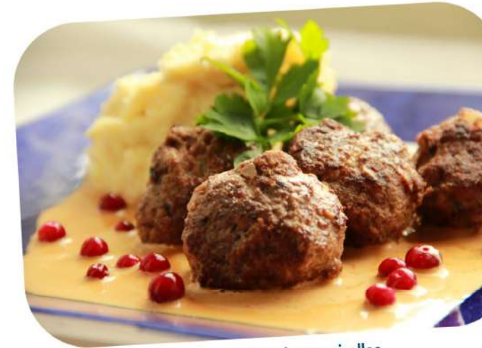
Boulettes de viande aux airelles

C'est vraiment délicieux et bon pour la santé.