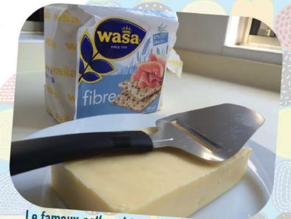
Le fameux osthyvel , trancheur de fromage.