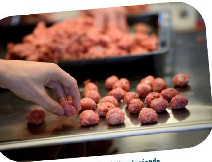
Préparation des boulettes de viande