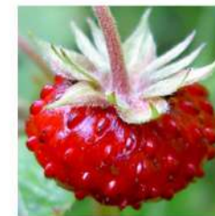
Smultron (Fraises Sauvages)