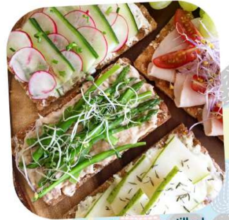
Des tartines de pain croustillant.