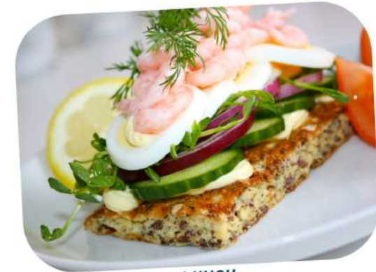
LUNCH Tartine aux crevettes

Le déjeuner : assez tôt, dès 11h et jusqu'à 12h30. Assez léger : généralement une soupe, une salade ou une tartine aux crevettes et aux crudités, ou au fromage et à la charcuterie. Pas de dessert, souvent un biscuit avec le café.