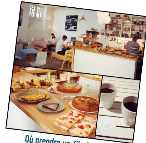
Où prendre un fika à Paris ? Au café de l'Institut Suédois