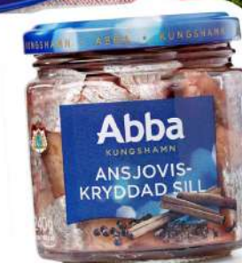
Hareng et anchois marinés