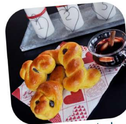
Lussekatter et vin chaud

Pour finir sur une petite note salée assez originale, voici le smörgåstårta ou "gâteau-sandwich" ! Il se compose de plusieurs couches de pain brioché sur lequel on étale une sauce crémeuse à la mayonnaise, souvent à l'aneth, puis on dépose des crevettes, du saumon fumé ou des œufs de poisson, des rondelles de concombre, de tomate et de citron, des tranches d'œuf dur, des lamelles de fromage.