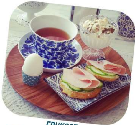
FRUKOST Thé, tartines, yaourt aux amandes et œuf dur

Le petit-déjeuner : vers 6-7h. Sucré ou salé : porridge d'avoine, fruits secs et frais, céréales au lait fermenté ou au yaourt, tartines au fromage ou à la charcuterie, œuf dur, thé ou café. C'est le repas le plus important pour beaucoup de Suédois.