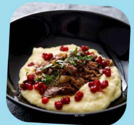
Renskav : Ragoût de renne