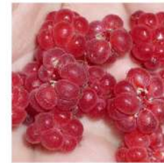
Skogshallon (Framboises Sauvages)