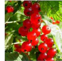
Röda Vinbär (Groseilles)

Parmi elles, les fraises, les fraises sauvages, les mûres, les framboises et les myrtilles, mais il existe d'autres sortes méconnues en France, comme la hjortron , appelée en français "mûre boréale" car elle ne pousse qu'au nord du cercle polaire.