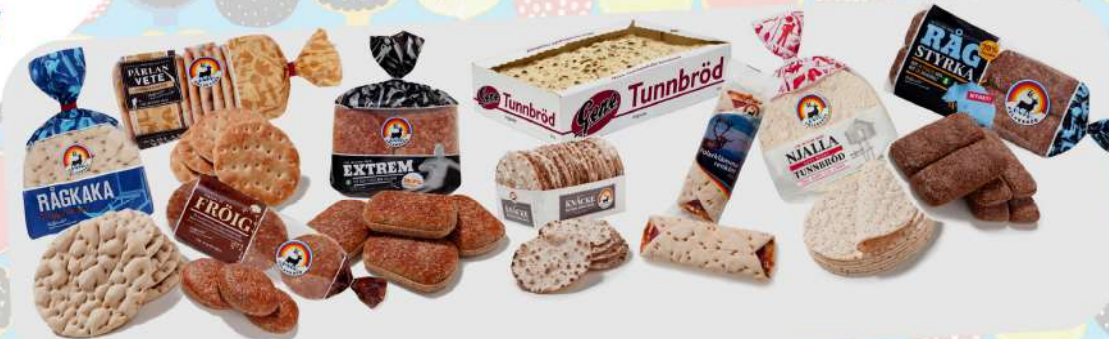
Différentes sortes de pain suédois.