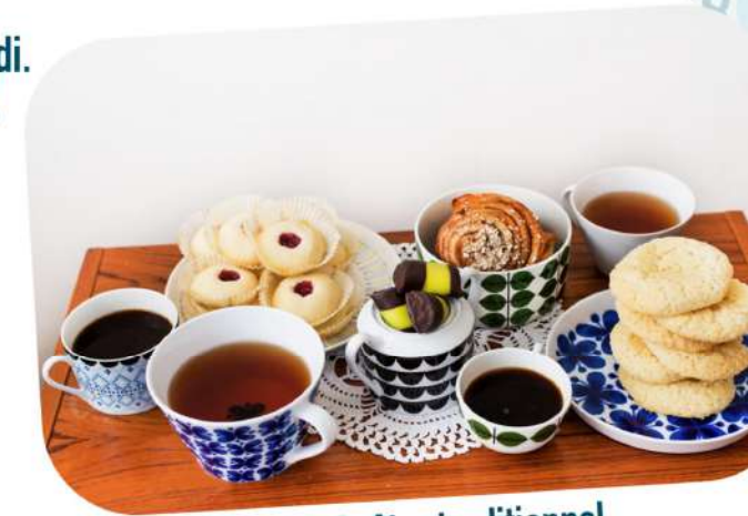
Fika, Goûter traditionnel