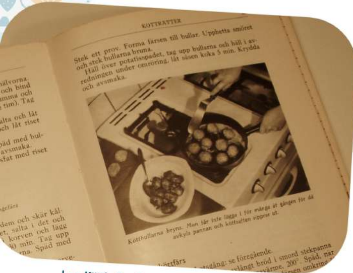
Les Köttbullar dans un livre de recette