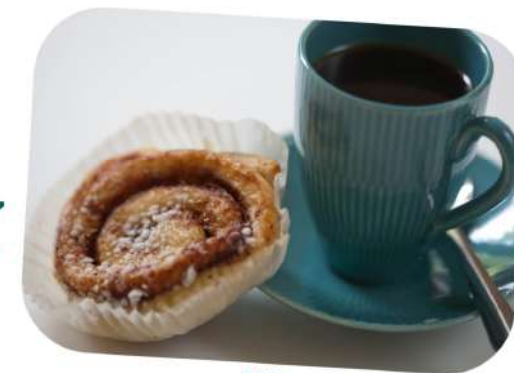
FIKA Un petit pain à la cannelle et un café

La pause café d'environ 15 min, a lieu plusieurs fois par jour : vers 10h le matin, vers 15h l'après-midi, et souvent vers 21h30 le soir !