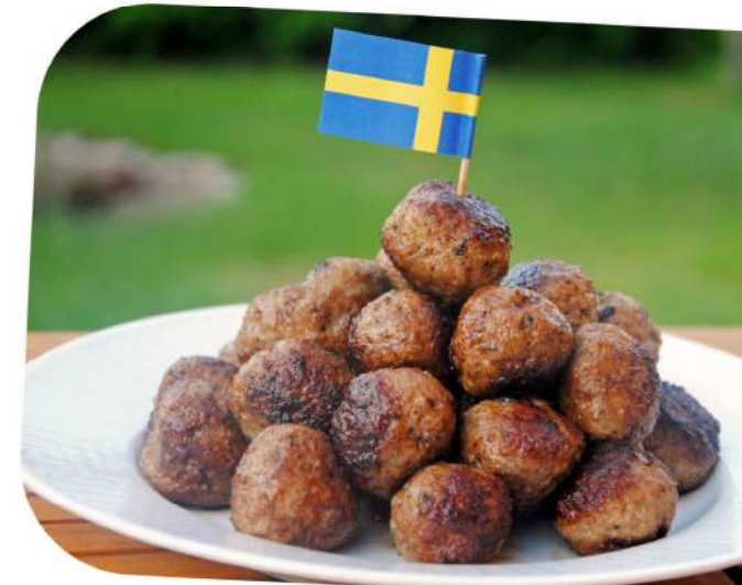
Le plat national en Suède