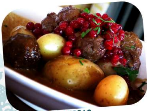
MIDDAG Boulettes de viande aux airelles