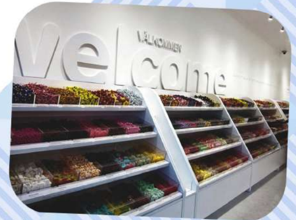
Le rayon des bonbons dans un supermarché

Le Fredagsmys , ou "cocooning du vendredi", est une tradition existant depuis une vingtaine d'années, qui marque aujourd'hui la vie des familles suédoises. Il consiste simplement à se réunir en famille ou entre amis, pour décompresser juste avant le week-end, et regarder la télévision ensemble autour de boissons et de choses simples qui se mangent souvent avec les doigts ( plockmat ), comme des chips, des tacos (un plat désormais typiquement suédois !) et bien sûr, des bonbons achetés au kilo.