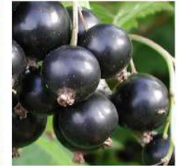
Svarta Vinbär (Cassis)