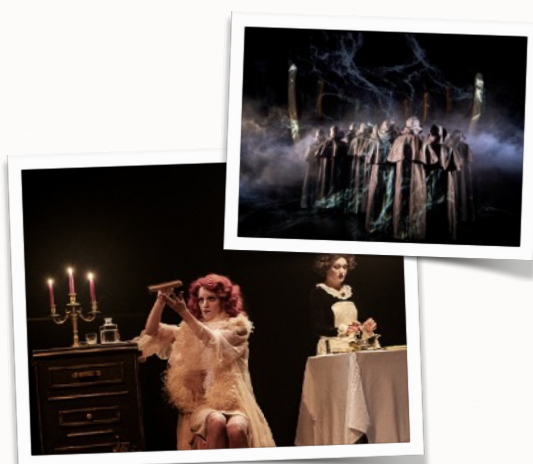
Le conte des contes ; Moby Dick ; Le Bourgeois gentilhomme et d'autres encore...